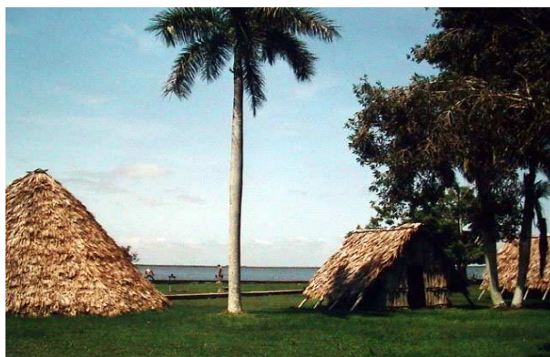
Replika wioski Indian- Guama

Półwysep znajduje się na południu prowincji Matanzas. W mieście o tej samej nazwie odnajdziemy dziś zaniedbany już hotel Louvre, oraz wiele muzeów, min. Museo Historio Provincial, Museo Farmaceutico, Parque de los Boberos ( zabytkowa remiza i wóz strażacki). W niedalekiej okolicy zwiedzać można jaskinie z imponującymi stalaktytami i stalagmitami. Nad morzem znajduje słynny z pięknych plaż kurort Varadero. Zaspokoiwszy swą żądę kąpieli słonecznych, odważny turysta powinien ruszyć w kierunku Casa de Al. - dawnej posiadłości Ala Capone, dziś słynnej restauracji.