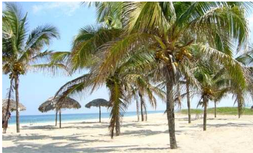
Dziewicze, kubańskie plaże