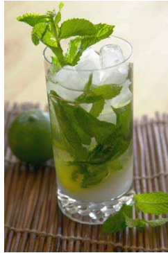
Popularny drink Mojito

amerykańscy turyści. Bawiono się wtedy odwiedzając kasyna, kluby nocne, korzystając z licznych domów publicznych, a w ciągu dnia grano w golfa lub spędzano godziny na słonecznych plażach ze szklanką Bacardi w dłoni lub "bywając" na różnych spotkaniach towarzyskich (pokazy mody, rauty). O tamtych czasach świadczą już tylko legendarne zabawy w Social Club'ie czy sceny z filmu Soy Cuba.