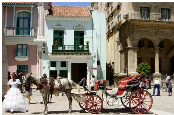
Stare miasto Hawany

Już od miejsca, w którym wyspa wynurza się z wody, Hawana zachęca ona do jej zwiedzania, prezentując Malecon - nadmorską promenadę znajdującą się nieopodal kamiennych fortyfikacji z okresu świetności Hawany - Castillo de la Punta i Castillo del Morro. Promenadę, którą krótko można określić jako "taniec i rum do rana". Hawana jest dziś miastem stosunkowo nowoczesnym, choć szczególną uwagę przyciąga tzw. "stara Hawana", czyli przede wszystkim XVII wieczna dzielnica ze słynnym Plaza de Armas, pełnym uroczych kawiarenek i restauracji. Tam również znajduje się kubańska kopia Partenonu, czyli El Templete, oraz najstarsza w mieście budowla - Castillo de la Real Fuerza - forteca otoczona fosą z kilkoma zwodzonymi mostami.