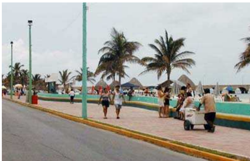
Promenada nadmorska Malecon w Hawanie

Hawana, jako stolica kraju katolickiego, może pochwalić się przepięknymi kościołami i katedrami. Najstynniejszą jest wzniesiona w stylu barokowym katedra przy Plaza de la Catedral. Przy całej religijności Kubańczyków, nie zabrakło tu nigdy mafii. Ta, w latach 40., stworzyła dwie dzielnice Hawany - Miramar i Vedado.